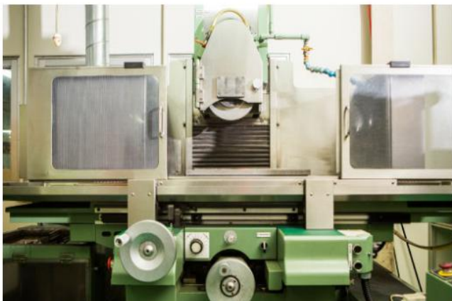
超精密成形平面削盤