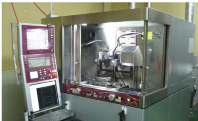
超精密マイクロプロファイル研削盤