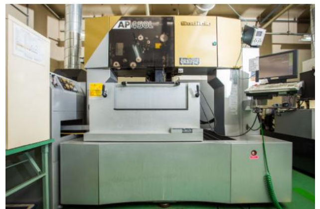
超精密ワイヤーカット放電加工機