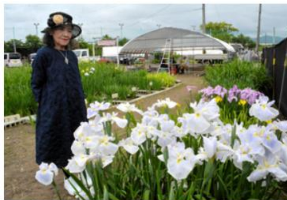
咲き始めたハナショウブ=2024年5月15日午前11時42分、和歌山県御坊市野口