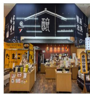
とれとれ市場 南紀白浜店